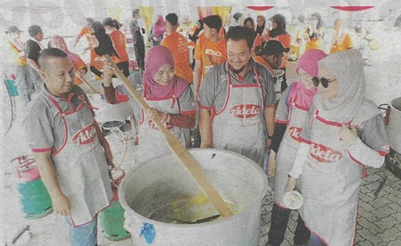
Aktiviti memasak bubur lambuk dilakukan secara bergotong-royong bersama penuntut institusi pengajian tinggi, chef dan selebriti.

"Kita masa bubur lambuk ini bersama melibatkan seramai 120 penuntut dan kakitangan Universiti Teknologi Mara (UiTM) Pun-