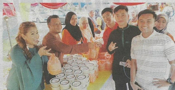
Sebanyak 20 periuk bubur lambuk yang dimasak diedarkan kepada orang ramai, pasukan beruniform dan masjid sekitar Shah Alam.

Majlis turut dimeriahkan dengan penyampaian sumbangan daripada pihak FGV Holdings Berhad kepada beberapa badan kebajikan selain pelancaran edisi khas lebaran Majalah Rasa.