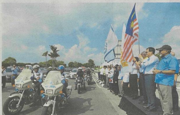
Baru melepaskan konvoi keselamatan ketika merasmikan Kempen Keselamatan Lebuhraya Sempena Hari Raya Aidilfitri di Grand Sepadu, Klang, semalam.

Klang: Tindakan tegas akan dikenakan terhadap pihak berkaitan jika ada unsur kecuai dalam kejadian paip pecah di jajaran pembinaan Lebuhraya West Coast Expressway Sdn Bhd (WCE) Banting-Taiping awal bulan ini.